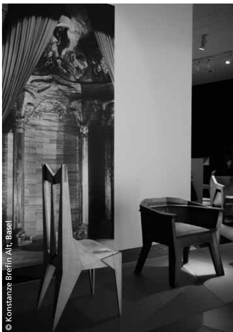
© Konstanze Brefin Alt, Basel Stühle: Wilhelm von Heydebrand, 1923, und Gerhard von Ruckteschell, 1928.

seit Ende der 1980er-Jahre mit der Idee, das Werk Steiners einem breiteren Publikum zugänglich zu machen.