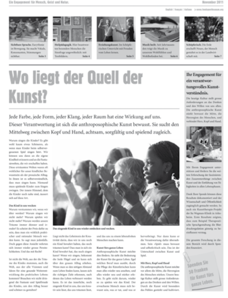
Der Entwurf zum neuen FondsGoetheanum-Heft über die Kunst