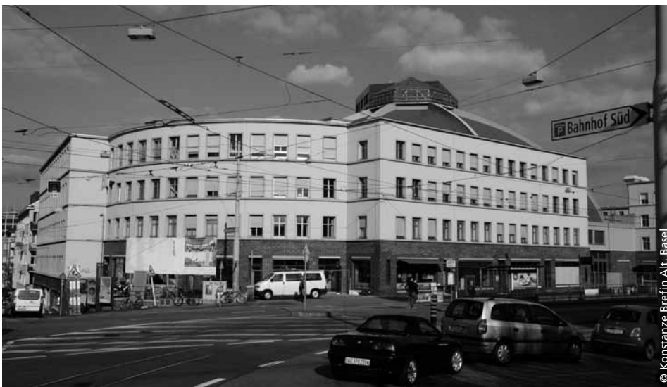
In dieser gerundeten Ecke ist das Ita Wegman Ambulatorium in der architektonisch interessanten Markthalle (Kuppel im Hintergrund) Basel untergebracht.

Die Nachfrage nach ambulanter anthroposophischer Medizin steigt. Und gerade für Basel ist absehbar, dass anthroposophische Hausärzte in Pension gehen werden. Die Ita Wegman Klinik in Arlesheim war schon seit längerem bestrebt, das therapeutische Angebot auszubauen. Mit dem Umbau der ehemaligen Markthalle Basel konnte sie in Bahnhofsnähe attraktive Räume mieten und das Ita Wegman Ambulatorium eröffnen, mit dem sie dem Ziel, eine vernetzte medizinische Grundversorgung aufzubauen, ein gutes Stück näher gekommen ist.