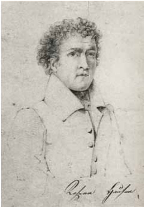
Kaspar Hauser in seinem letzten Lebensjahr. Bleistiftzeichnung von unbekannter Hand, 1833.

der Öffentlichkeit zu dem Fall geäußert. Dieser Vorgang ist vorbildlich insofern, als dass er sich dabei strikt auf die Tatsachen beschränkte, die auf jeden Fall erwiesen waren; mit keinem Wort geht er auf die Erbprinzen-theorie ein, mit keinem Wort werden Hypothesen, Unüberprüfbares oder Kriminalistisches berührt. Er spricht von einer Seele, die künstlich zurückgehalten worden war ; und stellt diese Tatsache in den Zusammenhang der Evolution des menschlichen Bewusstseins und der Gedächtniskräfte. Alle diese Inhalte sind ja breit dokumentiert und in grössere Zusammenhänge gerückt – in exemplarischer Weise bei Peter Tradowsky oder Karl Heyer, in neuester Zeit bei Juliane Cernohorsky-Lücke.