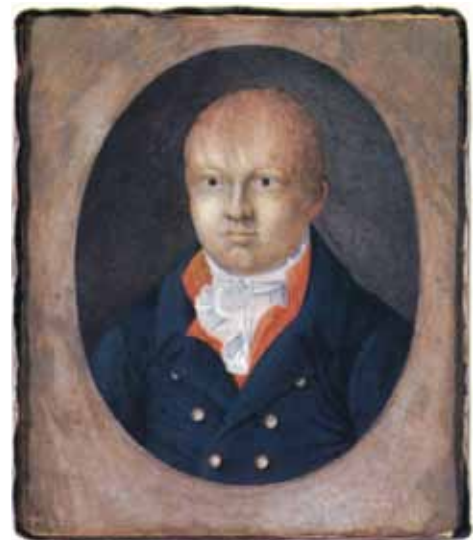
Elfenbeinminiatur, um 1828, von unbekannter Hand. Die Sprachlosigkeit Kaspar Hausers bei seinem Erscheinen scheint hier am Eindrücklichsten eingefangen.

Dieses Frageverbot, oder dieses Nicht-Wissen, ist ein Gralsmotiv. Auch die Tatsache, dass ein Toter, in diesem Fall Kaspar Hauser, mit 20 Jahren begannen kann, das Leben eines anderen zu überschatten, zu begleiten – zu inspirieren womöglich, trotzdem es zu einer persönlichen Begegnung nicht gekommen war; diese Tatsache setzt sich als Phänomen in die Gegenwart fort. Noch immer weiss man nicht, wer Kaspar Hauser war; noch immer sind Herkunft, Name strittig. Noch immer bleibt er eine Projektionsfläche, wor-