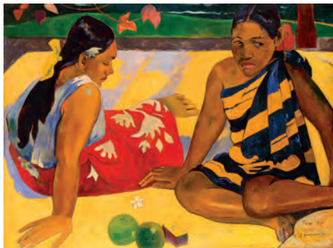
In Basel: Paul Gauguin, Parau api (Was gibts Neues?), 1892

Ich freute mich auf eines meiner Lieblingsbilder van Goghs, die «Japo-