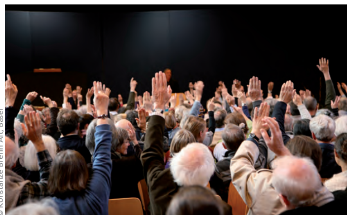
Einstimmigkeit in der Mitgliederversammlung. Approbation lors de l'assemblée générale.