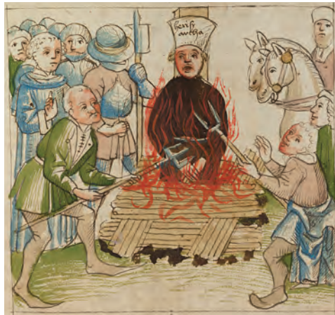
Ulrich Richental, Chronik des Konstanzer Konzils: Jan Hus auf dem Scheiterhaufen.

Woher kam Jan Hus? Er war als Kind armer Bauern um 1371 im Böhmerwald geboren, er hatte die Möglichkeit, auf eine Lateinschule zu gehen, besuchte dann die Prager Universität, erwarb dort 1396 den Grad eines «Magisters artium» und lehrte in dieser Fakultät. Dann studierte er Theologie und wurde 1400 zum Priester geweiht. Nun las er täglich die Messe in der St.-Michals-Kirche und wurde Prediger in der 3000 Zuhörer fassenden Bethlehem-Kapelle, welche der tschechischen Sprache vorbehalten war. In vielem orientierte Hus sich an den Thesen des Oxforder Theologie-Professors John Wycliff. Allerdings in der Auffassung des Altarsakramentes unterschied er sich wesentlich von ihm, doch davon konnte er beim Konstanzer Konzil seine Gegner nicht überzeugen. Für ihn behielt die Wandlung von Brot und Wein ihren sakramentalen Charakter, sie war ein Mysterium zur Entwicklung der Ich-Findung, ebenso wie auch das Evangelium. «Gottes Friede hat stets drei Seiten: den Frieden mit Gott in Christo, den Frieden des Menschen mit sich selbst und den Frieden des Menschen mit dem Nächsten.» Jan Hus