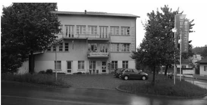
Die Kunstkeramik in Ebikon La «Kunstkeramik» à Ebikon

Vor elf Jahren war die Delegierten-Konferenz schon einmal in der gerade neu eröffneten Kunstkeramik in Ebikon LU eingeladen. Was damals schon spürbar war, zeigte sich jetzt in aller Deutlichkeit: Es herrscht ein guter Geist in dem schön umgebauten und innenarchitektonisch freundlich und licht gestalteten Haus mit angenehmer Atmosphäre. Gebildet wird sie durch das Chinderhus Wanja, in dem rund 20 Kinder im Alter von 4 Monaten bis zum Kindergarteneintritt betreut werden, ein Textilatelier, in dem gewoben und gefilzt wird, die beiden therapeutischen Ateliers Praxis MUT Musiktherapie und ZwischenRaum sowie durch die Kunstwerkstatt eines Trickfilmers und Illustrators. Und natürlich nicht zuletzt durch die Christengemeinschaft Luzern und den Niklaus von Flüe-Zweig, die beide ihren Sitz dort haben. Der Saal wird immer wieder für Vorträge, Veranstaltungen und Konzerte genutzt und vermietet. Für Maja Brunold wurde das Haus der Grund, im Zweig mitzuwirken.