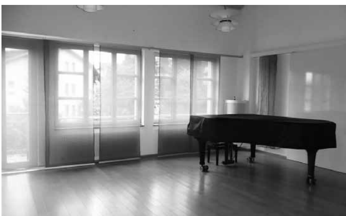
Der Saal mit dem Flügel La salle avec piano