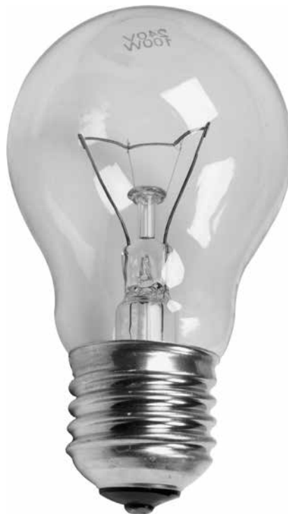
Der Klassiker: Die Glühbirne

Unabhängig von der Frage nach dem Energieverbrauch sollten wir uns generell besinnen, ob wir überhaupt so viel, so helles und vor allem ständig Kunstlicht brauchen. Vom Beginn der Industrialisierung an bis heute haben wir durch die Verwendung von Kunstlicht im Tagesmittel eine ganze Stunde mehr Licht. Allerdings scheint z. B. die Depressionsrate davon unberührt – obwohl sich eine Depres-