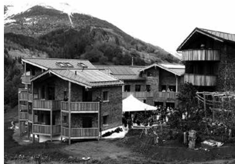
Das GenerationenHaus Ernen.

Das GenerationenHaus mit zwölf Wohneinheiten von 1-Zimmer-Studio bis zur 3½-Zimmer-Wohnung für Dauergäste, Hotel und B&B-Besucher möchte einen sinnerfüllten Lebensort schaffen, wo Jung und Alt sich begegnen und füreinander da sein können. Zudem werden in der Bergregion Arbeitsplätze geschaffen. Die biologisch-dynamische Landwirtschaft trägt zur