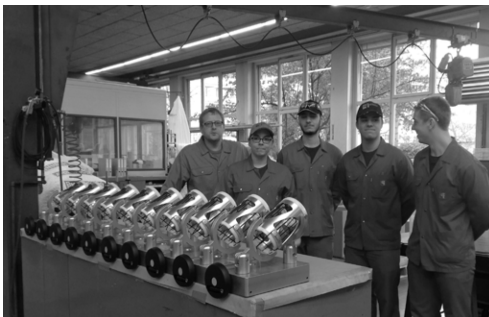
Ausbilder und Lehrlinge der LW Basel mit dem RHYTHMIXX.

Informationen und Anmeldung: Goetheanum Empfang, Postfach, 4145 Dornach, Fax 061 706 44 46, Tel. 061 706 44 44, E-Mail tickets[at]goetheanum.org , www.goetheanum.org .