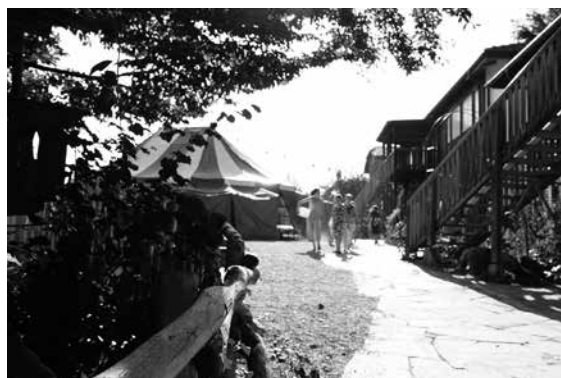
Ecole Rudolf Steiner Berne Ittigen Langnau