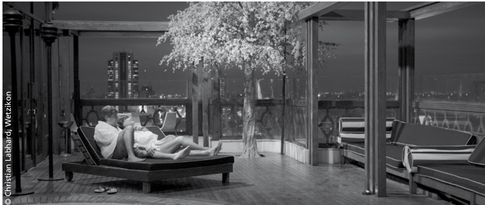
Still aus «Passion»

kündigt der Regisseur ihn so an: «Ein Film über meinen Umgang mit der schmerzlichen Tatsache, dass die Welt heute nicht so ist, wie ich sie mir vor 50