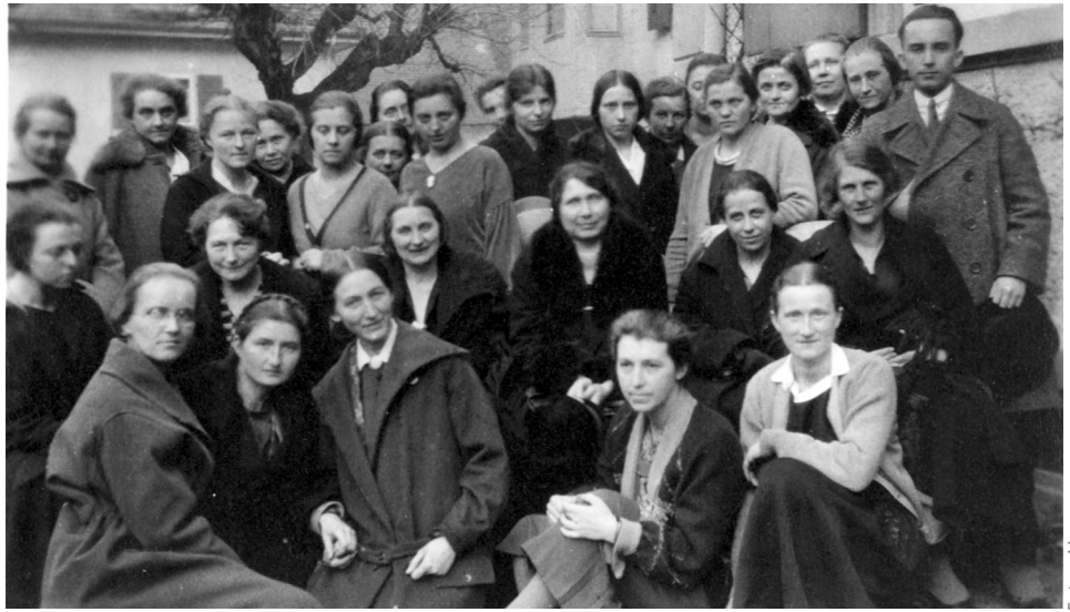
1926, Schwesternkurs, in der Mitte sitzend: Ita Wegman, Aufnahme vor dem Sonnenhof.

Rolle und Funktion, Selbstverständnis und Bild der Pflege haben sich im Lauf der Jahrhunderte stark verändert. Ging es zunächst um zwischenmenschliche Hilfe innerhalb des Familien- oder Stammesverbandes, übernahm die Pflege schon in den Hochkulturen und der Antike die Aufgabe ärztlicher Assistenz. Seit dem frühen Christentum prägt das Ideal der tätigen Nächstenliebe, der Caritas, die Pflege. Die Caritas war im Mittelalter Grundlage für zahlreiche Ordensgründungen, die sich der Kranken- und Armenpflege verschrieben. Ab dem 18. Jahrhundert entstanden erste von Ärzten initiierte Krankenpflegeschulen. Florence Nightingale veröffentlichte die erste pflegetheoretische Schrift und reformierte die konfessionell unabhängige Pflegeausbildung. In den Vereinigten Staaten wurden bereits 1910 erste pflegewissenschaftliche Studiengänge eingeführt, die Pflegeforschung begann. Und doch dauerte es noch mehrere Jahrzehnte, bis aus der Krankenschwester die Pflegefachfrau resp. aus dem Krankenpfle-