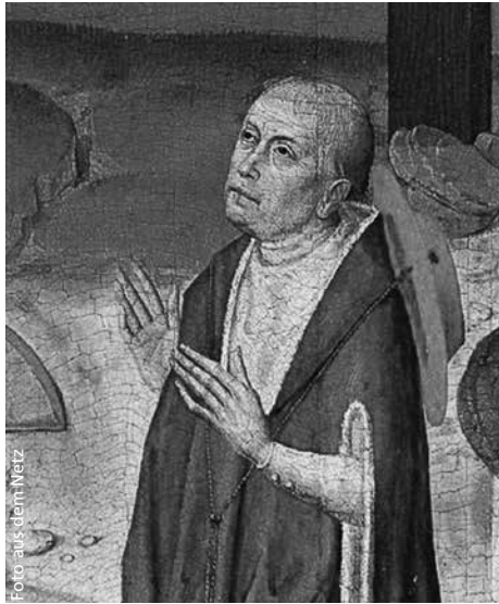
Nikolaus von Kues. Zeitgenössisches Stifterbild vom Hochaltar der Kapelle des St.-Nikolaus-Hospitals, Bernkastel-Kues

Die Erkenntnissuche des Cusanus im Entstehungsmoment der Naturwissenschaft ist bedeutend für die Erkenntnisausrichtung der Anthroposophie als Geisteswissenschaft – bedenkt man, dass Rudolf Steiner die 100 Jahre zwischen Cusanus «Docta ignorantia» und die Entdeckungen von Kopernikus einen «Entstehungsmoment» nennt, so könne man sagen, führte Constanza Kaliks den Gedan-