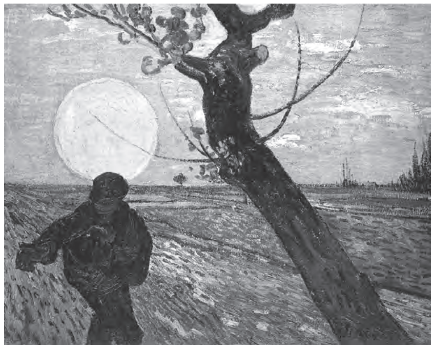
Oben links: Jean-François Millet: «Buchweizenernte im Sommer», 1874; rechts: Vincent Van Gogh: «Ernte in der Provence», 1888; unten links: Jean-François Millet: «Sämann», 1850; rechts: Vincent Van Gogh: «Sämann bei untergehender Sonne», 1888.