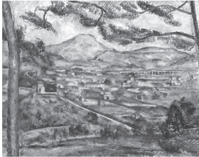
Paul Cézanne: «Mont Sainte Victoire mit grosser Kiefer», ca.1886/87.