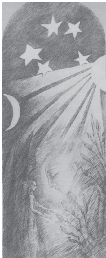
Das rosa Nordfenster / Le vitrail nord rose

In den Ansprachen an die Waldorfschüler hat Rudolf Steiner immer wieder darauf hingewiesen, dass sie aufmerksam sein sollten darauf, was sie als den «Geist der Schule» erleben (Zdrazil 2021) 4 . Dieser Geist würde sie nämlich nicht verlassen, sondern sie im weiteren Leben begleiten, ihnen Trost, Rat, Licht spenden. Insbesondere wenn es schwere Zeiten gibt mit Verzweiflung, Ratlosigkeit, darf man auf die Unterstützung dieses guten Geistes der Schule hoffen. Man darf sogar darauf hoffen, dass dieser Geist im späteren Leben wesentlich erscheint, zu einem spricht, einen aufrichtet und beisteht. Das rosa Nordfenster des Grossen Saales im Goetheanum zeigt uns diese Situation im oberen Motiv. Es zeigt eine Engelsfigur, die